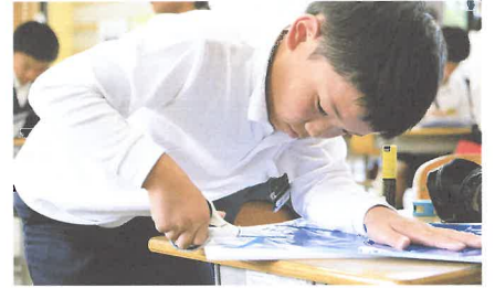
菟田野小学校でのワークショップ風景